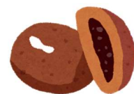
かりんとうまんじゅう