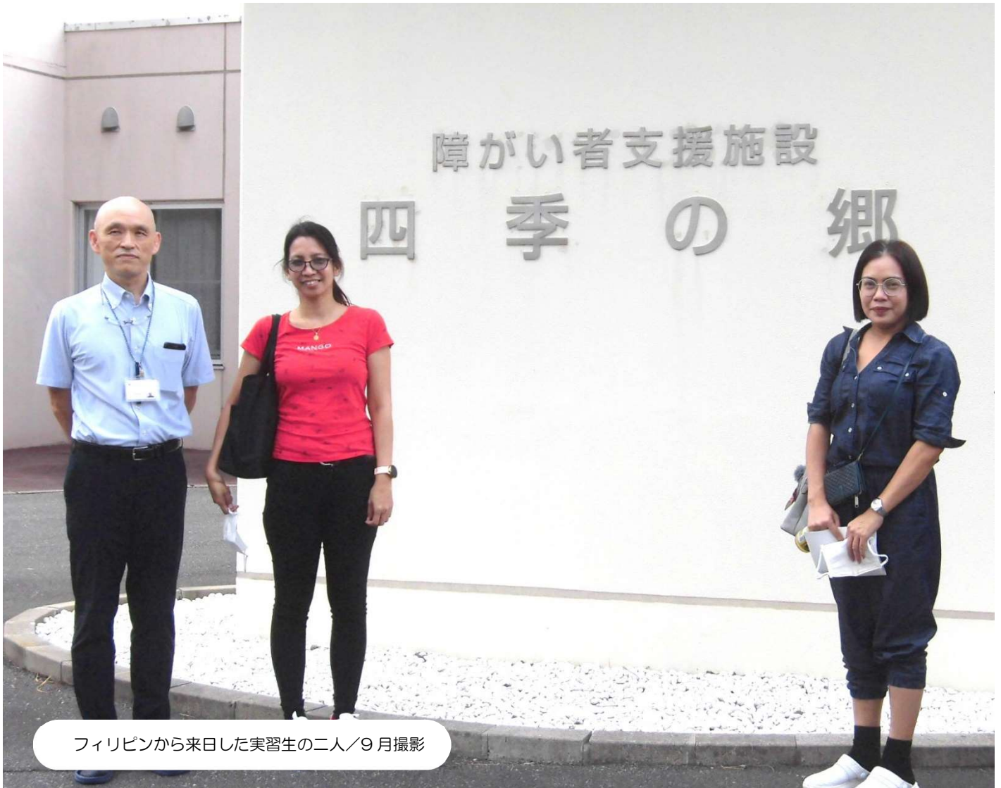
フィリピンから来日した実習生の二人／9月撮影